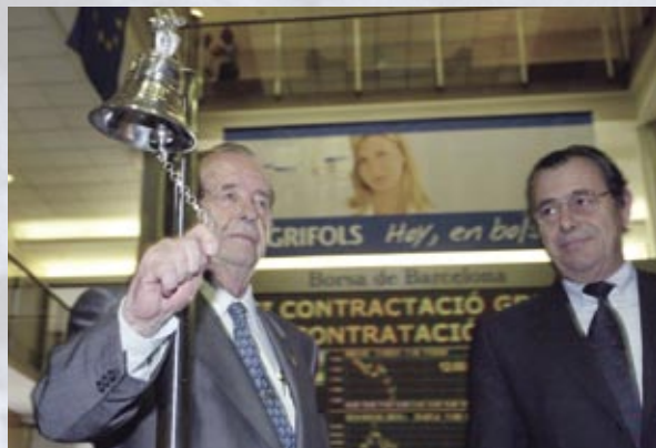
Bolsa de Barcelona, 17 de mayo de 2006. Debut bursátil de GRIFOLS