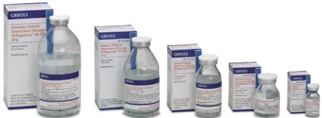
Todas las presentaciones de la Flebogamma DIF aprobada por la FDA en diciembre de 2006.