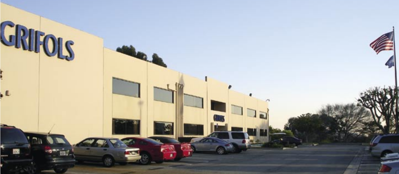
Sede central de Grifols en Estados Unidos. Los Angeles, California