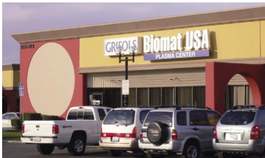
Centro de plasma de Orange, California

No obstante, 31 millones de euros de esta facturación del año 2006 corresponden a las ventas de plasma a Talecris tras la compra de la empresa PlasmaCare Inc en Estados Unidos. La obligación contractual existente termina el 28 de febrero de 2007; a partir de entonces todo el plasma de PlasmaCare se destinará al consumo del grupo.